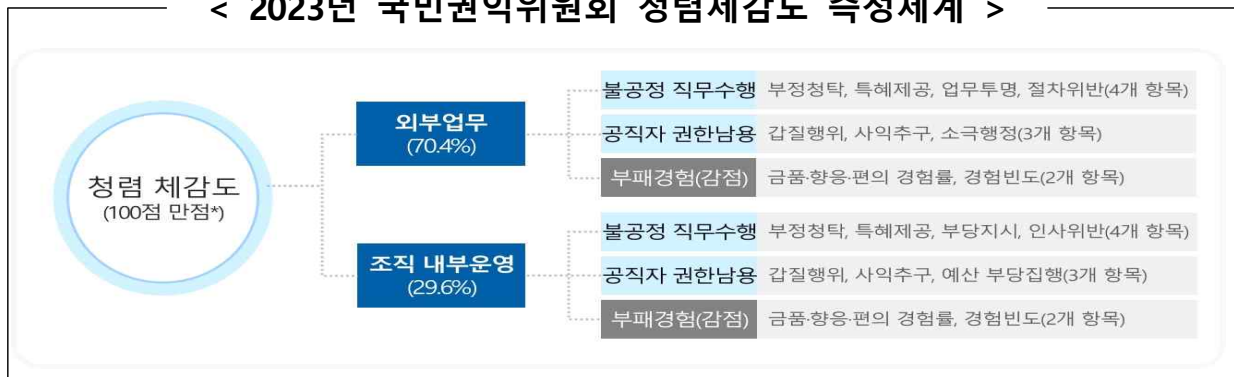
< 2023년 국민권익위원회 청렴체감도 측정체계 >