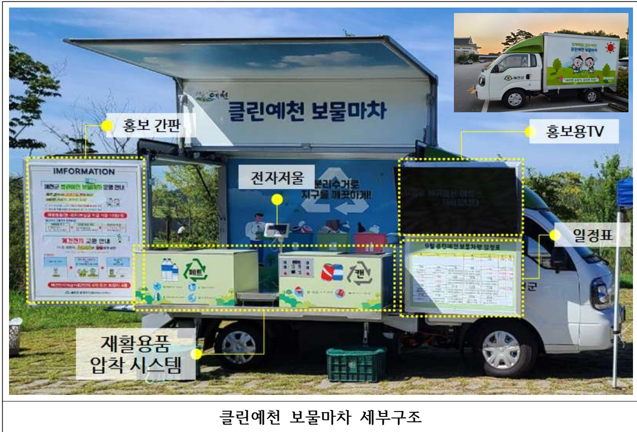
클린예천 보물마차 세부구조