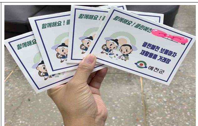
클린예천 보물마차 인센티브 거래장