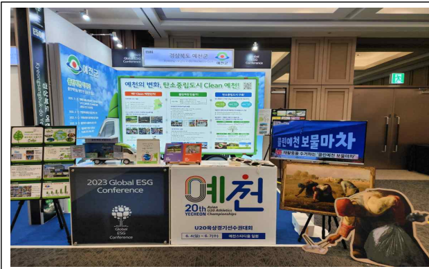
글로벌 ESG 컨퍼런스 홍보부스 운영