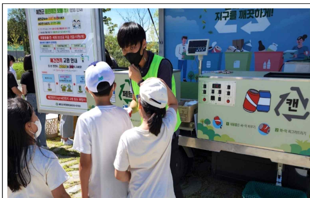
클린예천 보물마차 운영