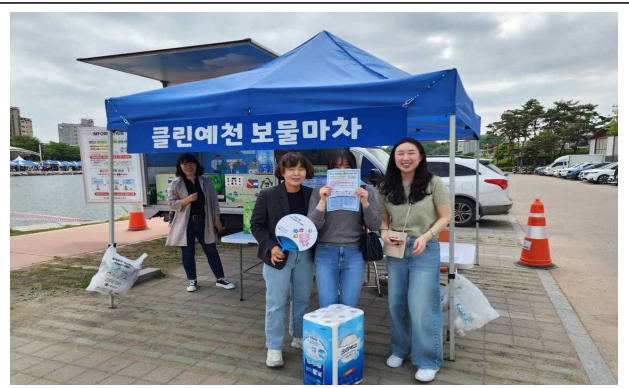
예천군 세계활축제 참여이벤트 운영